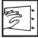
Apply Appliquer Coloque