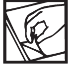
Peel Retirer Despegue