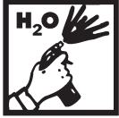
Spray Mouiller Humedezca