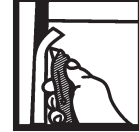
Trim Découper Corte los bordes