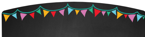
PLACA DE PIZARRA RE-ESCRIBIBLE.