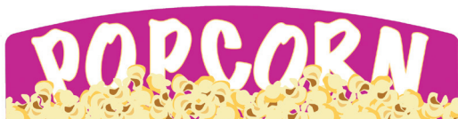
PLACA DE "POPCORN"