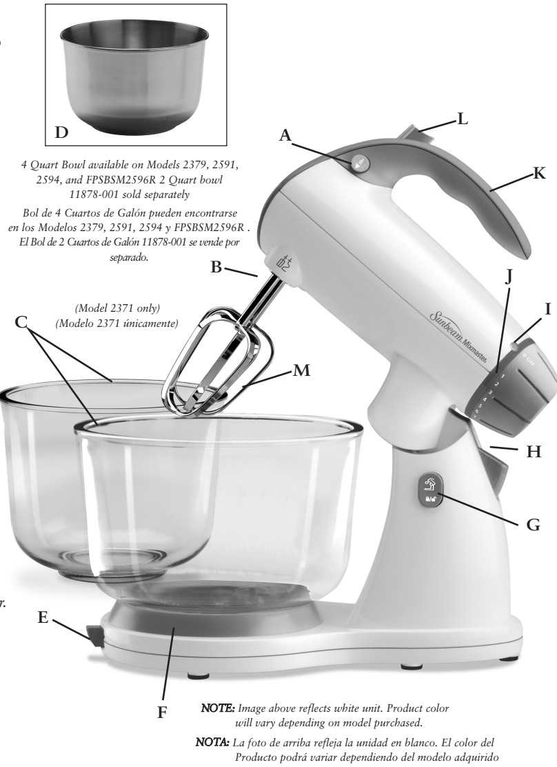
D 4 Quart Bowl available on Models 2379, 2591, 2594, and FPSBSM2596R. 2 Quart bowl 11878-001 sold separately. Bol de 4 Cuartos de Galón pueden encontrarse en los Modelos 2379, 2591, 2594 y FPSBSM2596R. El Bol de 2 Cuartos de Galón 11878-001 se vende por separado.

NOTE: Image above reflects white unit. Product color will vary depending on model purchased. NOTA: La foto de arriba refleja la unidad en blanco. El color del Producto podrá variar dependiendo del modelo adquirido